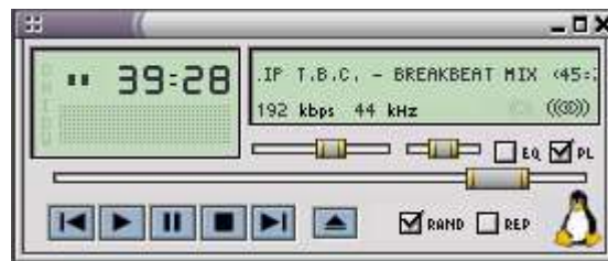
Xmms - přehrávač pod Linux

Ovladače na grafickou kartu už byly v instalaci obsaženy, takže jsem se nemusel o nic starat. Modem mi dal trochu práce, stáhl jsem si ovladače od dovozce pro ČR a k tomu i manuál. Zabralo mi to se čtením manuálu asi hodinu, ale ten čas jsem zase ušetřil při konfiguraci připojení, které mi přišlo jednodušší než ve Windows.