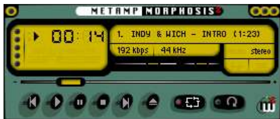
Winamp - přehrávač pod Windows

Stáhl jsem si druhou vývojovou verzi Mandrake Linux 9.2, která byla na 4 CD. Na vývojovou (sice druhou ale i tak) verzi je to velice stabilní systém. Používám ho teprve měsíc a zatím jsem zaznamenal 3 pády aplikací, poprvé mi spadl xmms (linuxový Winamp), když jsem si spustil 6 vizualizací najednou, později Mozilla (webový prohlížeč), když jsem testoval, co všechno umí a kolik toho unese a nakonec jednou OpenOffice (netuším proč). Když to porovná s Windows, které se mi zasekávaly denně, přijde mi to jako kvalitní systém.