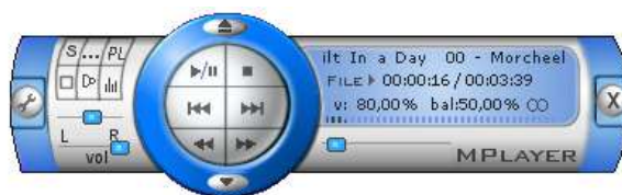
MPlayer - přehrávač videa pro Linux

Můj třetí Linux. Verze na 3 CD. Jako první mě překvapilo grafické provedení instalace, na to jsem nebyl z Windows ani předchozích Linuxů zvyklý. V instalaci bylo také obsaženo více softwaru. Jako uživateli Windows mě to přišlo taktéž nezvyklé. Bylo to asi jako kdybych si nainstaloval Windows a už bych měl v instalaci zahrnut Winamp, vypalovací software, Office, Partition Magic, Windows Commander, všechny kodeky, přehrávač na video, přehrávač na DVD a vůbec všechno, co jsem kdy potřeboval. Chyběl mi zde jen nějaký příjemnější přehrávač videa. Ten jsem si stáhl a i nainstaloval. Instalace nového software je podstatně složitější než ve Windows, usnadňují to ale rpm balíčky (popíšu později).